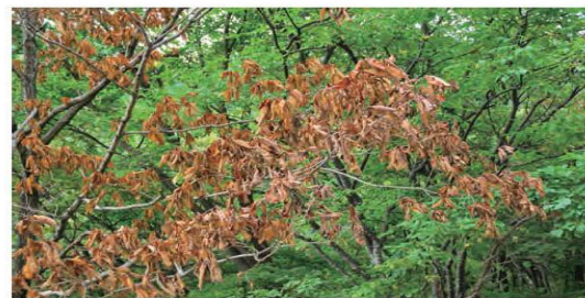
葉が茶色や赤茶色に変色