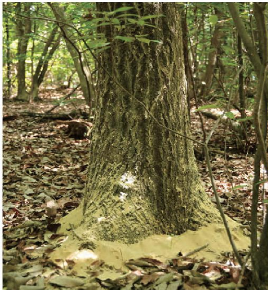
カシナガの穿入孔から大量にフラスが排出され根元付近に積もる。(被害木は樹齢40～50年生以上の大径木が多く、直径30cm程度の被害木からカシナガが数万頭飛び出すこともある)

害発生初期段階においては、初期防除の観点から可能な限り駆除することが望まれます。