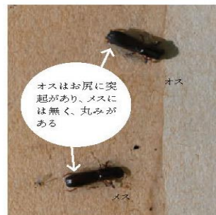
カシナガの成虫(体長5mm)。上:オス、下:メス。カシナガには近縁種が多く、どれもよく似ていますが、今のところ、健全木に穿入するのはカシナガだけです。他の種類は、衰弱木や枯死木に二次的に穿入します。枯死木を見ただけでは、虫の穿入が先か、枯死が先かを判断するのが難しく、ナラ枯れかどうかの判断には虫の鑑定が必要になります。